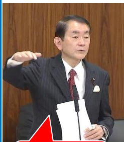
総務大臣「兵庫県知事の問題、どう思いますか！」

まず一つ目、『公益通報者保護』について、 兵庫県知事 の一件が大変問題になっています。「公益通報者保護法」をめぐる消費者庁の所管であつて、今国会でも 解雇に刑事罰を科す などの改正を目論んでいます。私は「人間として対応すること」の大切さを提言させて頂きました。総務省もこのあたりは、リーダーシップを取って頂きたいと思ひます。