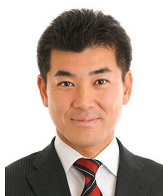
泉健太 (47) 政調会長