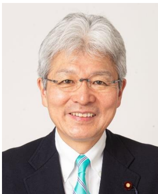
逢坂誠二 (62) 元首相補佐官