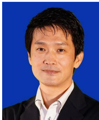
小川淳也 (50) 元総務政務官