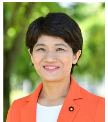
西村智奈美 (54) 元副厚生労働相

■野田国義プロフィール■ 1958(昭和33)年生まれ。福岡県立福島高校卒業。日本大学法学部卒業。代議士秘書を経て、34歳で八女市長に初当選。全国最年少市長(当時)として全国の話題を集め、「改革派・市民派市長」として“オープン・フェア・クリーン”の政治姿勢で4期16年市長職を務める。2009年衆議院議員に初当選(3年3ヶ月)、農林水産委員会/理事、福岡県連代表。2013年参院選福岡選挙区で初当選、2019年7月・2期目の当選。これまでに、参議院/国土交通委員長、行政監視委員長、予算委員会/理事、決算委員会/理事、議院運営委員会/委員、総務委員会/委員、消費者問題特別委員会/理事、災害対策特別委員会/理事、国の統治機構に関する調査会/理事、地方制度調査会/委員。議員連盟の活動では、お茶振興議連/事務局長、花き産業振興議連/事務局長、都市農業推進議連/幹事長等を歴任。現在、会派/立憲民主・社民、議院運営委員会/次席、国土交通委員会/委員、災害対策特別委員会/理事、資源エネルギーに関する調査会/理事。