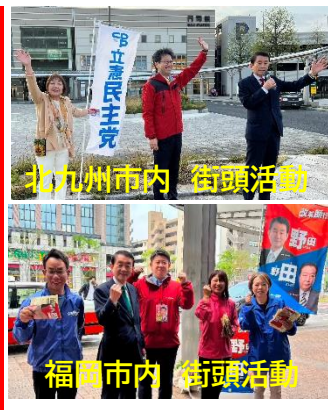
北九州市内 街頭活動