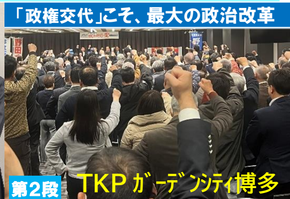
第2段 TKP ガーデンシティ博多