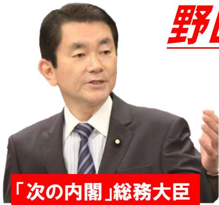
「次の内閣」総務大臣