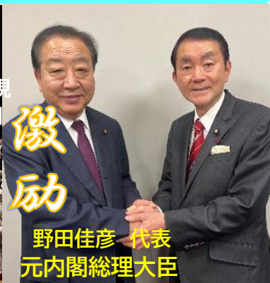
野田佳彦 代表 元内閣総理大臣