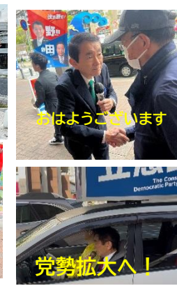
おはようございます